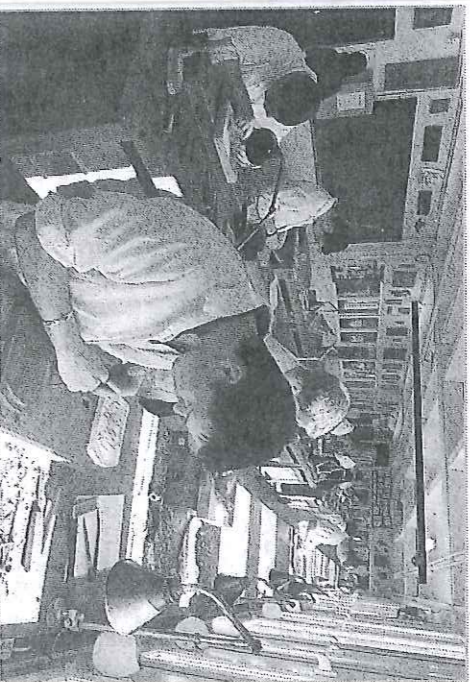
Parents et élève pourront découvrir les différentes formations proposées lors de cette journée portes ouvertes.

APPIA Est-Nord de Liffol et la section d'enseignement professionnel du lycée général et technologique de Neufchâteau organisent, l'un et l'autre, une journée portes ouvertes demain samedi.