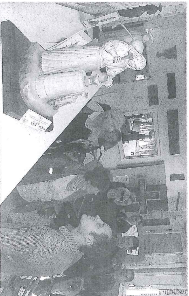
Enseignants, chef d'établissements scolaires, conseillers d'orientation, psychologue ont pu découvrir tout au long de la journée d'rieler des filières encore trop méconnues.